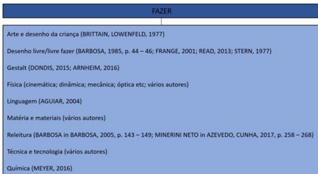
Figura 3. Sugestões bibliográficas para o eixo Fazer da Abordagem Triangular.