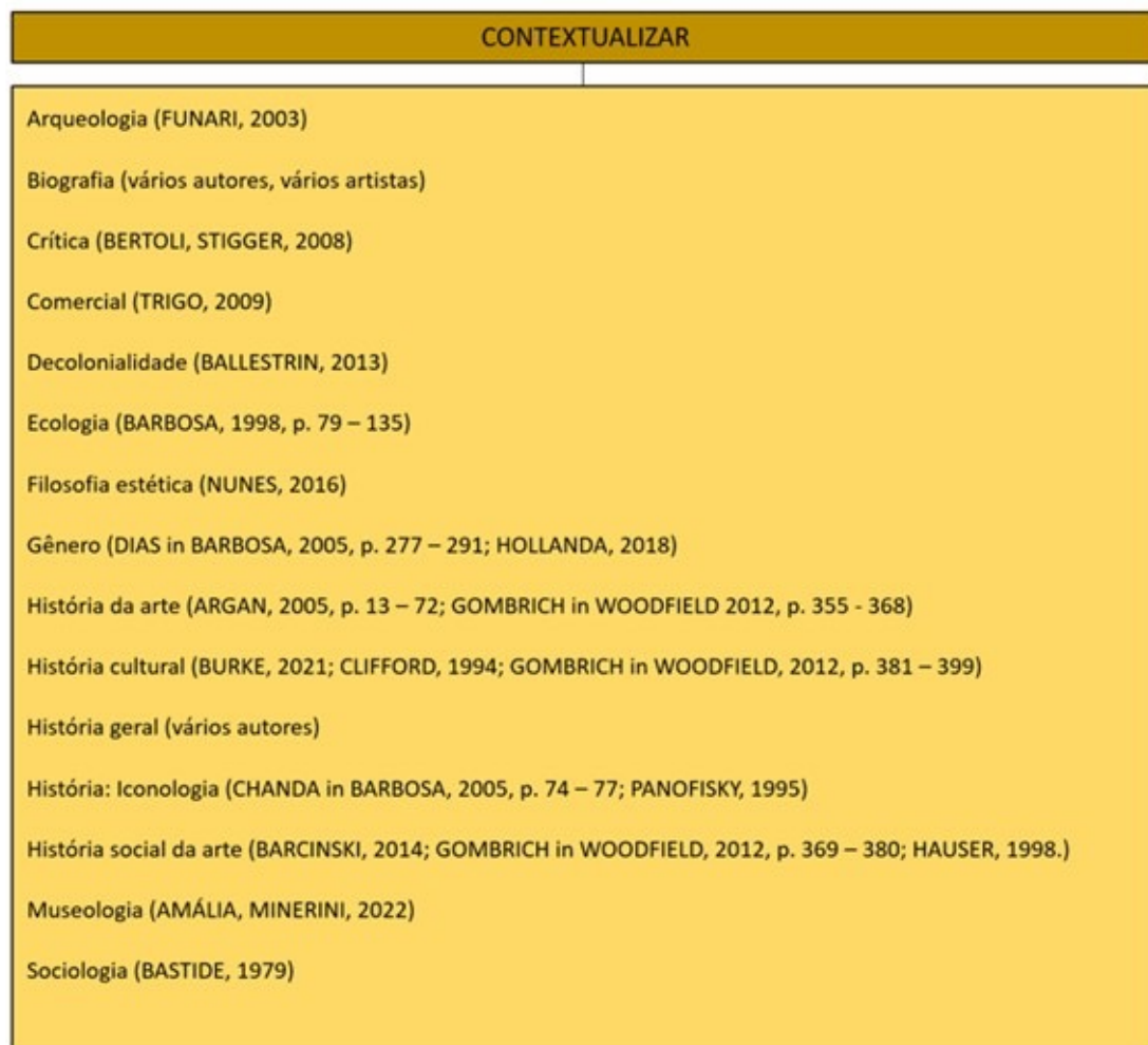
Figura 2. Sugestões bibliográficas para o eixo Contextualizar da Abordagem Triangular.

A seguir apresentamos sugestões de textos (Fig. 2, 3 e 4) para cada item apresentado no referido painel, todos com informações detalhadas nas referências bibliográficas que estão ao final, as quais também se portam de modo aberto, pois muitos outros livros podem ser inseridos.