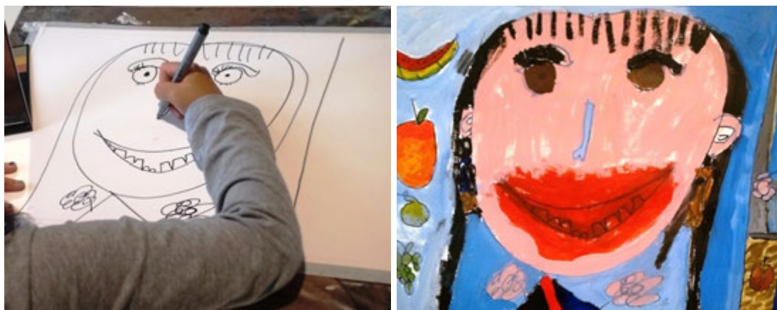
Figuras 3 e 4.

Aluna de 6 anos e 4 meses desenhando o autorretrato. Pintura finalizada, com destaque para a boca vermelha