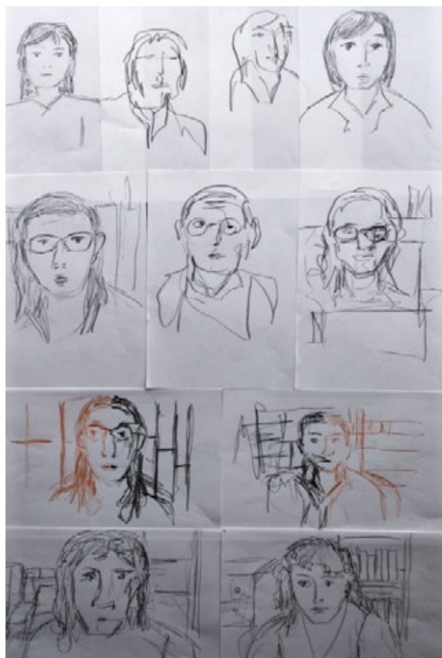
Figura 5. Exercícios realizados durante a oficina online: desenhos a partir de minha observação dos participantes presentes

Fizemos os retratos dos participantes, que previamente selecionamos e ao término da proposta seguiu-se uma roda de conversa, onde compartilhamos o resultado dos trabalhos e os relatos sobre a experiência de posar, observar e representar o outro e a si próprio. Essa prática permitiu a desconstrução da ideia de beleza ideal, ressignificando as nossas relações com o corpo e a produção artística, tornando-se uma importante ferramenta de investigação do mundo a partir do desenho.