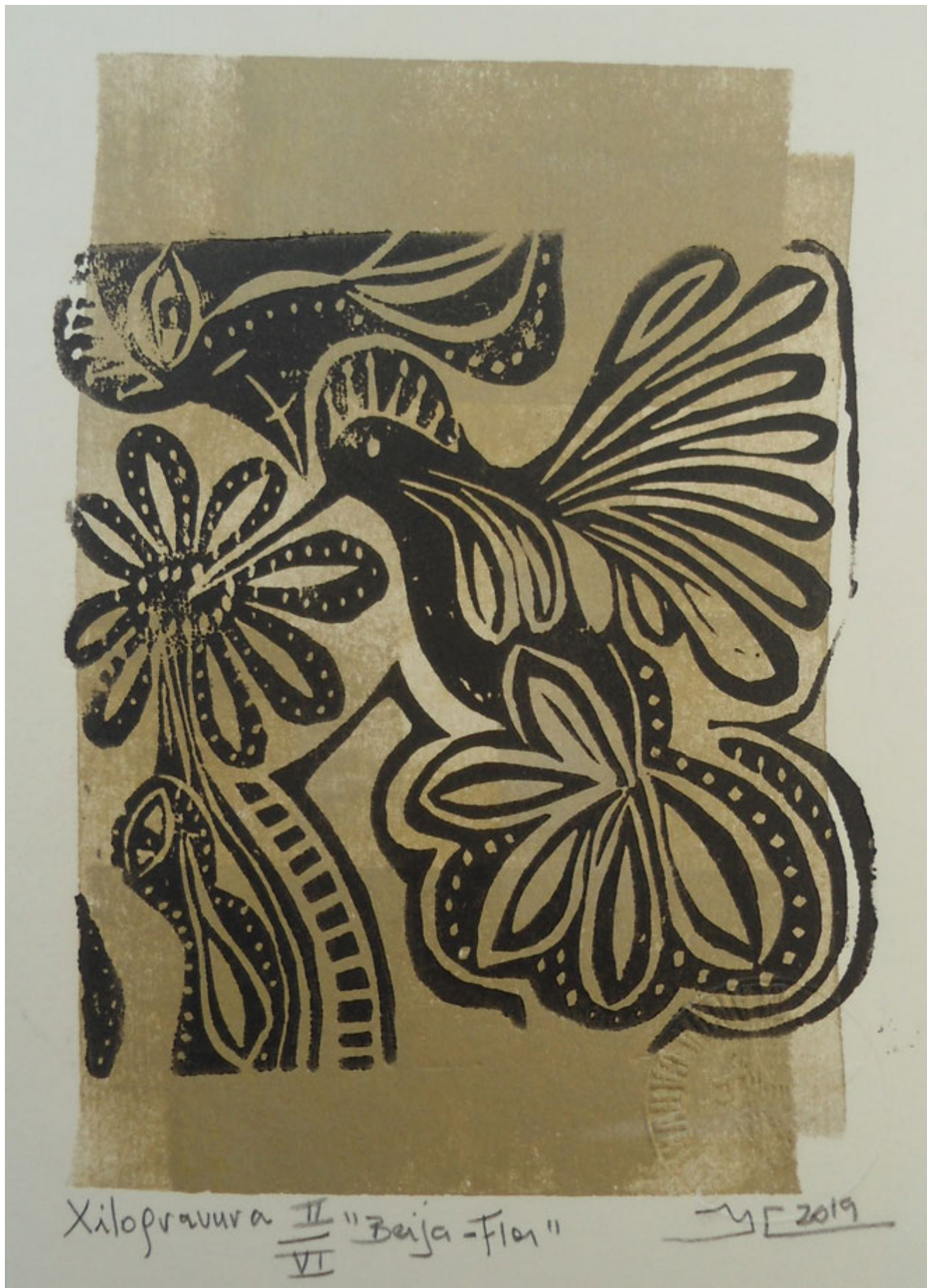
"Beija-Flor" Yolanda Carvalho