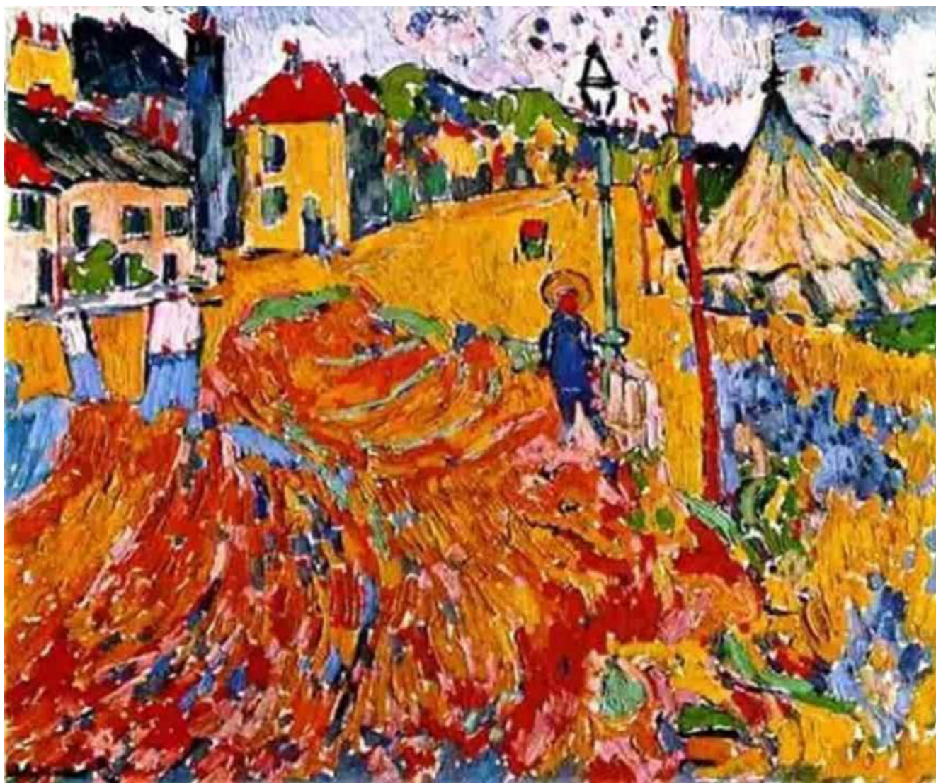
Figura 1 — Fonte de inspiração - The Circus, 1906, Maurice de Vlaminck

O desenvolvimento do projeto de redesign do objeto começa pela escolha do período e artista que cada um aprecia. Em seguida, passa-se para a etapa de projetar/desenhar e inserir as características escolhidas no objeto escolhido, camiseta e tênis, com a definição do tema e desenhos na proporção passa se à execução do projeto no objeto escolhido. A seguir imagens do trabalho desenvolvido baseados na Abordagem Experiencial e Abordagem Triangular.