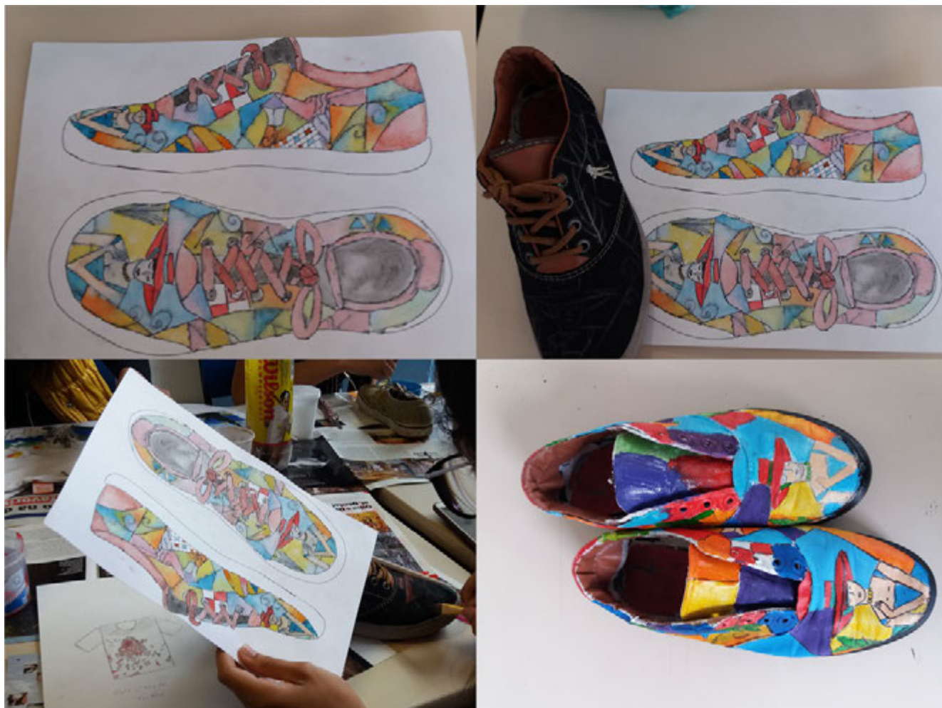
Figura 2 — Desenvolvimento tênis – baseado no The Circus, 1906, Maurice de Vlaminck