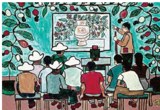
Figuras 9 e 10. Guaches do artista de Pernambuco Francisco Brennand, que servia de base para a discussão do conceito de cultura nos Círculos Culturais.