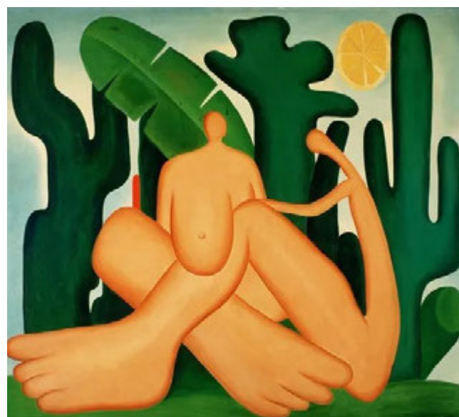
Figura 4. Tarsila do Amaral, ANTROPOFAGIA, 1929 .