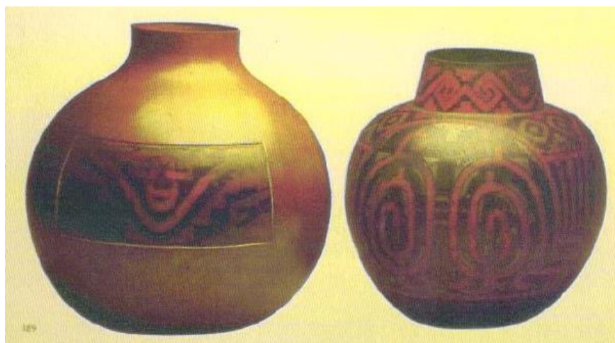
Figura 1: Theodoro Braga, Jarros de cobre e latão, decoração Marajoara.

1) Indianismo e nacionalismo - Este movimento foi ridicularizado pelo exagero que atingiu, transformando-o em orgulho excessivo, desmedido, ufanismo com intenções de congelamento de posições de opressor e oprimido na sociedade e instrumento político de direita. As correntes internacionalistas mediadoras dos insidiosos processos de colonização “jogaram a água do banho com o bebê dentro” condenando artistas e professores que buscavam refletir sobre nossa cultura da mesma forma que condenaram aqueles que usavam esta mesma realidade para nos paralisar exaltando a pátria. Artistas e professores que operavam o equilíbrio multicultural e um nacionalismo crítico ou bem humorado como Theodoro Braga (1872- 1953) e Manoel Pastana (1888-1984) foram relegados ao ostracismo. Defenderam a adesão à linguagem internacional, mas os temas escolhidos eram ligados à nossa flora e fauna e os textos deles analisavam nossa cultura, não a celebrando gratuitamente. Este movimento foi radicalmente renegado.