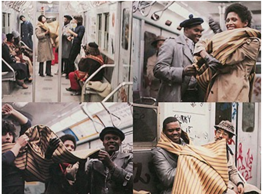
Hélio Oiticica em um metrô nos Estados Unidos com os Parangolés.