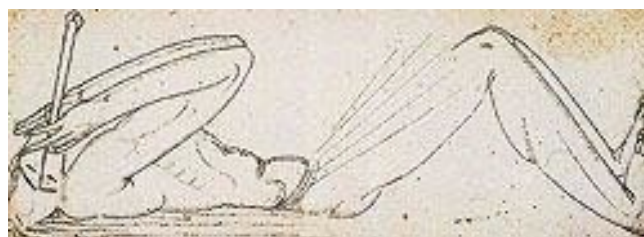
Figura 3. Vicente do Rego Monteiro - O ANTROPÓFAGO, 1921 (Col. Elza Ajzenberg).

A arte/educação modernista no Recife não foi subordinada ao movimento paulista. Lula Cardoso Ayres (1910-1987), muito ligado a Gilberto Freyre, realizou uma experiência expressionista com crianças, visitada por Augusto Rodrigues antes dele criar a primeira Escolinha de Arte no Rio de Janeiro (1948), que gerou o Movimento Escolinhas de Arte muito difundido por todo o país.