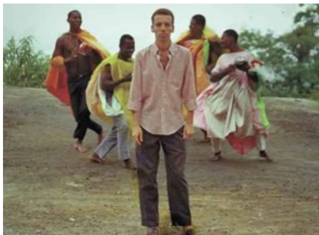
Figura 5. Hélio Oiticica com moradores da Mangueira vestindo seus parangolés