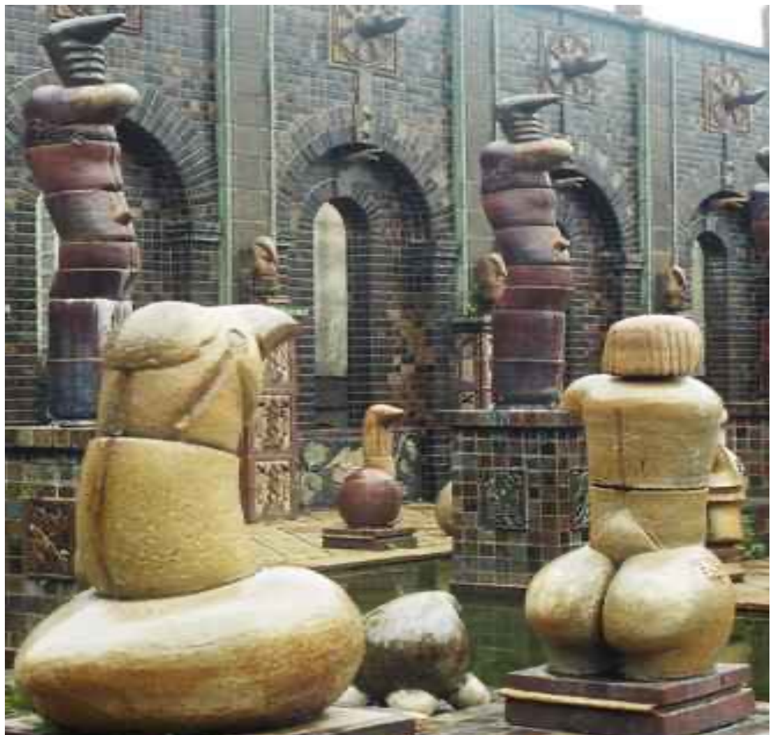
Francisco Brennand representativo do Movimento Armorial liderado por Ariano Suassuna no Nordeste, que reconheceu a Cultura Popular com o mesmo valor da Cultura hegemônica europeia, desde a Idade Média.