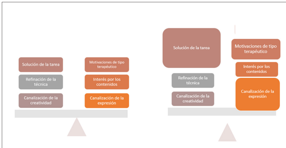
Figura 2. Diferentes motivaciones y su peso en una persona.