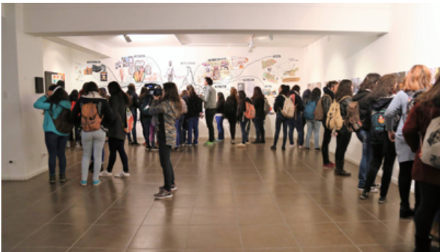
Foto 8. Inauguración de la exposición

Esta experiencia finalizó con dos exhibiciones diferentes. La primera exposición se presentó en el encuentro de talleres semestrales de Balmaceda donde se exhibieron los resultados de las experiencias de las diferentes áreas. La segunda, se realizó en la galería de artes visuales de Balmaceda donde tuvimos la oportunidad de presentar este taller de manera independiente a los otros talleres. En esa ocasión, además de presentar la cartografía como un punto de conexión con las ideas que estaban planteando, se presentó un relato donde cada participante explicaba su paso por el taller y, a su vez, su propuesta artística. Estos trabajos finales fueron registros fotográficos y audiovisuales de las diversas intervenciones que realizaron en la ciudad de Santiago.