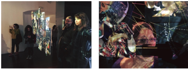
Foto 3. Interacción del público con la obra durante la exposición

El hecho de que público pudiese rodear la obra, acercarse a ella, tocarla, interactuar con sus elementos e incluso se fotografiarse con ella, le otorgó gran relevancia al papel del cuerpo y al carácter performativo. De esta manera, en dicha experiencia se entrelazaron fuerzas humanas, no-