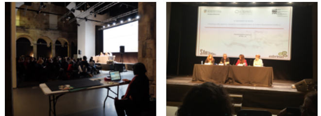
Foto 1. Encuentros durante la escuela de formación COST -IV New Materialism Training School

Con veinte años de antigüedad, este centro, que se ha destacado dentro del circuito artístico de Barcelona por impulsar el arte contemporáneo, actuó como un espacio ideal de reflexión y debate de ideas en torno a los nuevos materialismos. Las conferencias y talleres organizados dentro de la escuela de formación, en los nuevos materialismos, estuvieron marcados por temáticas diversas como las perspectivas de género, relación feminismo/ciencia/tecnología, políticas del afecto, fuerzas materiales, investigación y ética, educación artística, cuerpo/corporeidad, relaciones de poder, agencia/política/activismo, entre muchos otros. De aquí que el espacio propiciado por este evento internacional permitiese proyectar complejas conexiones y entramados.