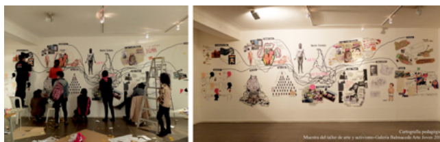
Foto 7. Montaje de la exposición. Poniendo en relación las cartografías

A medida que avanzaban los encuentros, la cartografía comenzó a formar una especie de espacio colectivo que nos permitía desarrollar una propuesta de trabajo marcado por una dinámica de intercambio de saberes y relatos de sus experiencias, donde cada uno abordaba su tema de interés y lo relacionaba con el activismo. Las ideas que surgían aludían a diversas temáticas: construcción de identidad(es), el abuso del poder, el cuerpo y la memoria, la humanización, el patriotismo, la publicidad sexista, el falocentrismo, la pobreza de la periferia de la ciudad, entre otras. De esta manera, la cartografía comenzó a cobrar fuerza y decidimos unir cada cartografía individual en un punto central, donde su conexión se realizó mediante un gran mapa invertido de América Latina apelando a la resistencia, subversión y modo de gestionar nuestro territorio, junto al título “Arte y activismo: nuestro territorio”.