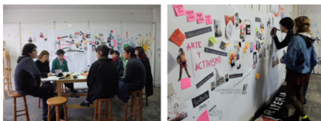
Foto 6. Proceso colectivo de creación y de conversación

De este modo, el compromiso con la realidad situada y la vinculación con el espacio nos llevo a considerar la performance artística como una herramienta principal, donde el cuerpo se relaciona directamente con lo político y con el activismo. A la sesión siguiente, varios jóvenes trajeron sus propias imágenes y, a partir de ahí, decidimos situarnos desde un espacio relacional de aprendizaje donde cada uno(a) podía presentar su propuesta y desarrollar el trabajo final para concluir el taller. Fue entonces cuando el dispositivo cartográfico comenzó a cobrar sentido dentro de este enredo y donde las diversas actividades se comenzaron a entrecruzar con nociones, ideas e imágenes que emergían de las conversaciones que sosteníamos en el taller.