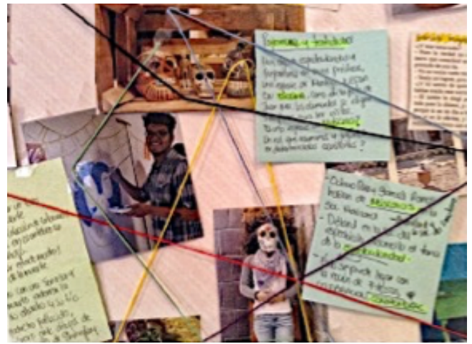
Foto 11. Detalle de la cartografía como herramienta de análisis

Inspirada también por el pensamiento de Georges Didi-Huberman (1990, 2000), para quien la imagen no ilustra ni representa, sino que constituye una suerte de espacio en la que se articulan tiempos complejos y heterogéneos, empecé a establecer relaciones pensando en su noción de síntoma y latencia. Así pues, me dejé guiar por pequeñas señales que representaban una apertura repentina y que me advertían de la presencia de algo más allá de lo visible. Noté que había detalles, similitudes o coincidencias en varios de los elementos que intentaba relacionar y me percaté de que en algún momento varios apuntaban en la misma o en distintas direcciones, trazando rutas que terminaron por entrecruzarse. De esta forma el síntoma funcionó como una especie de juego anacrónico de latencias y crisis, estableciendo una dinámica de movimientos que, al desgarrar la representación y fracturar la lógica, transformaron la imagen en núcleo de experiencias y campo de combate de fuerzas y tensiones.