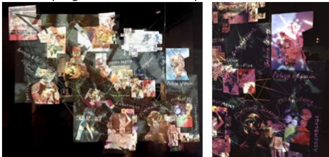
Foto 4. Obra terminada y expuesta

La lógica deleuziana y la teoría del assemblage (1983) nos ayudó a pensar en los bordes como algo indeterminado y móvil; un espacio donde se permiten vacíos, partes interconectadas y elementos que no son del todo visibles. Esto nos proporcionó numerosas posibilidades y conexiones para pensar la cartografía tanto dentro de sí misma como desde la relación con sus diversos componentes, su interacción con el espacio y con las personas. Este carácter inestable y performático que puede asumir la cartografía, implicó un entendimiento parcial y situado de todo aquello que sucedió en la compleja experiencia vivida en la escuela de formación, dejando abiertas múltiples posibilidades que de allí podían desprenderse. Asimismo, el intento de producir una obra in situ y, de alguna manera intentar llevar a cabo un proceso de investigación basado en las artes dentro de un plazo de 48 horas, representó un gran desafío para nosotras, provocando otros tipos de aprendizajes y saberes que generaron nuevos desplazamientos.