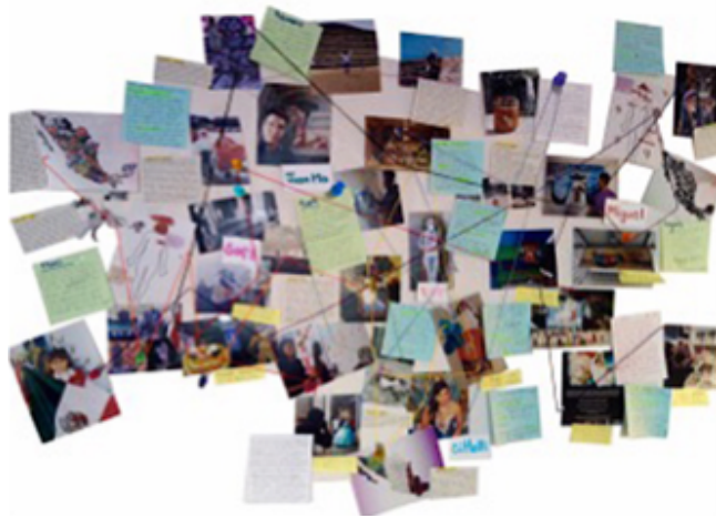
Foto 10. La cartografía como herramienta de análisis