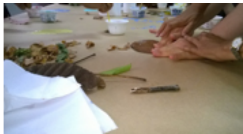
Figura 03 – 4º encontro grupo focal Ame Down – pintura coletiva pais/mães e filhos/filhas – tema minha natureza

paisagem, as plantas, os animais, todos/as responderam “natureza”, então o tema da atividade surgiu da compreensão dos/as participantes. Os/as Pais/Mães e os/as filhos/as fizeram uma caminhada pela UFPB recolhendo folhas, flores secas, pequenas pedras e galhos, que fosse possível colar no trabalho, como elementos naturais (figuras 03 e 04).