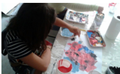
Figura 01 – 3º encontro grupo focal Ame Down – pintura têmpera vinílica

Uma das participantes M 1 . desde o primeiro encontro apresentou uma peculiaridade em relação a produção visual, falta de domínio de espaço, executando o trabalho com movimentos bruscos e largas pinceladas, utilizando excesso de camadas de tintas cobrindo toda a extensão do papel. Devido a essa especificidade foi necessário ampliarmos o tamanho do papel para os trabalhos dessa participante, bem como aumentar a gramatura do mesmo, que ameaçava rasgar devido ao excesso de tinta, passamos a utilizar cartolina guache como suporte (figuras 01 e 02).