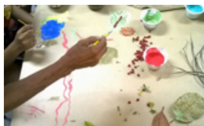
Figura 04 – 4º encontro grupo focal Ame Down – pintura coletiva pais/mães e filhos/filhas – tema minha natureza