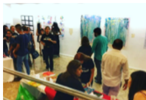
Figuras 05, 06, 07 e 08 – Exposição Arte Eficiente – 2016 e 2017.

Cartazes das exposições Arte Eficiente 1 e 2.