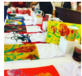
Figuras 9 e 10 – Objetos comerciais com imagens dos trabalhos dos/as participantes do GT Ame Down PB.