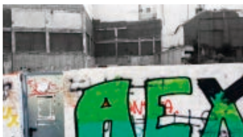
14. AEXHUELLAS (2017). Sotte. Jaén (España).