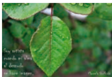
6. Soy artista cuando mi imagen al desnudo se hace imagen (2017). Marcela Giuffrida. Profesora de Artes Plásticas. Buenos Aires (Argentina).